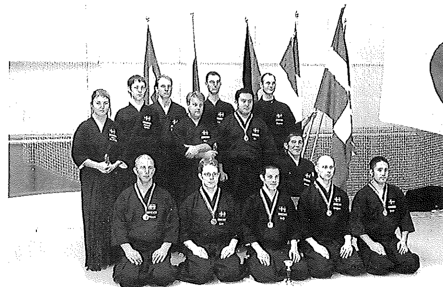
Det svenska iaidolandslaget 2004 med coacher - det mest framgångsrika iaidolandslaget någonsin.